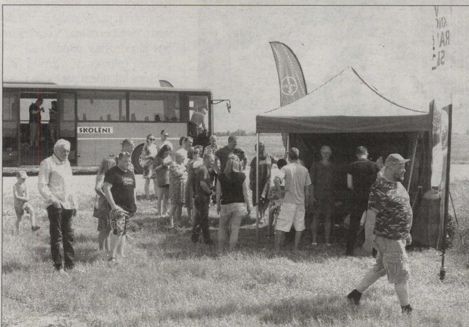
VIENA NO 37 kartē atzīmētajām pieturas vietām.

pa pušķītiem, tieši pusdienlaikā lauku klusumu piepildīja Smiltenes baznīcas zvanu skaņas, atgādinot par visu laicīgo un pār-laicīgo.