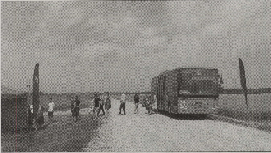
PIEBRAUC AUTOBUSS no Alojās ar ļaudīm no Valda Možvillo saimniecības.