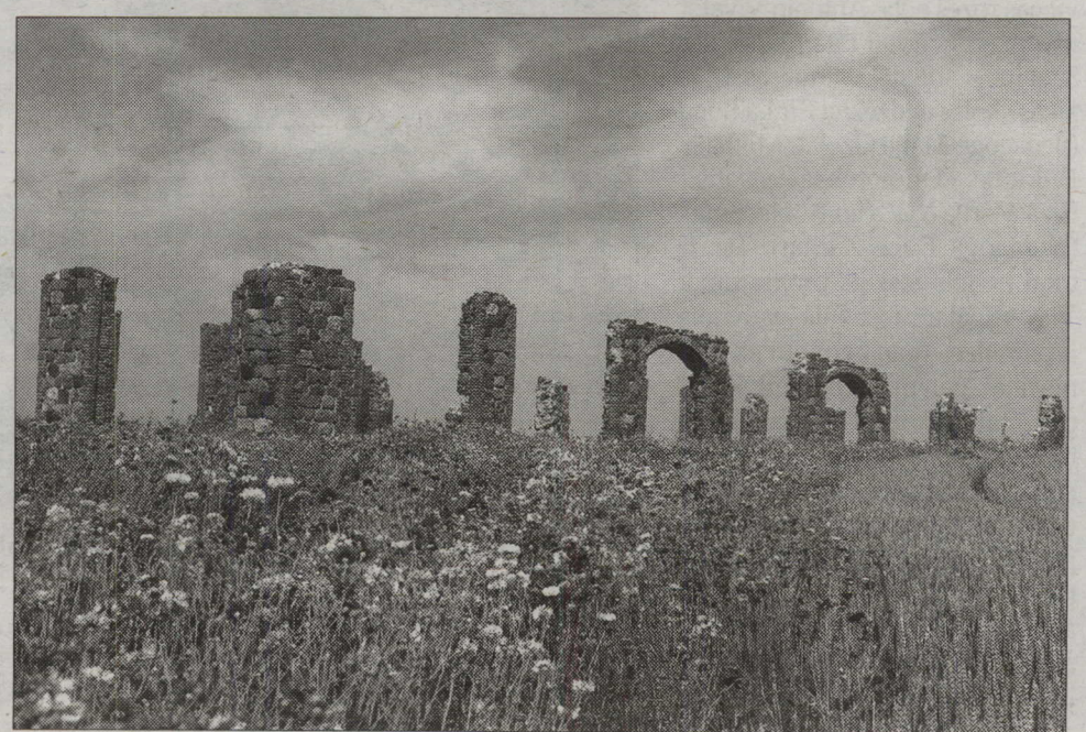
SMILTENES STOUNHENDŽA.