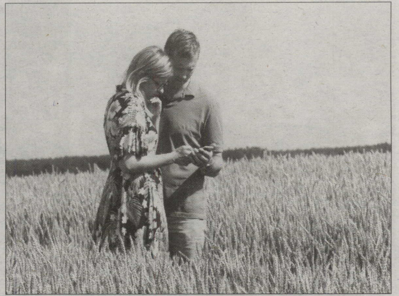
ZINTI UN IEVU no SIA «Vidzemīte» mobilā aplikācija atvedusi līdz punktam, kurā jāatbild uz jautājumiem.

Mūsu zemnieki Latvijas graudus audzē visu iespējamo – graudus, zirņus, pupas, griķus, rudzus, miežus, auzas, ķīmenes... bet nav tā, ka zemnieks visā saredz tikai praktiskumu un, mūžīgajos darbos skriedams, nepagūst ieraudzīt dabas daili smilgā vai lauku puķēm pilnā laukmalē. Lauku dienas apskatāmo saimniecību kartē bija atzīmētas arī fotografēšanās vietas, kas bija īpaši sagatavotas interesantu bilžu knipsēšanai. Zemnieka māksliniecisko dvēseles pusi lieliski raksturo, piemēram, Smiltenes pievārtē laukmalē cilvēku priekam iesētās krāsainās rudzupuķes